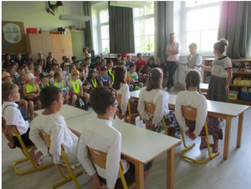
Šola nekoč; k sreči samo v gledališki igri

Zaključek smo preživeli skupaj na super delavnicah, ki so jih za nas pripravili učenci in učitelji v Ledinah: