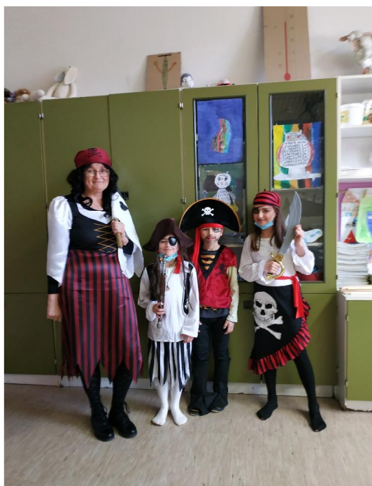
Gusarji v razredu

Minil je tudi prav poseben dan. Učiteljica je uvedla za dve šolski uri nov predmet – učenje igranja. Mogoče veste kaj je hotela s tem doseči?