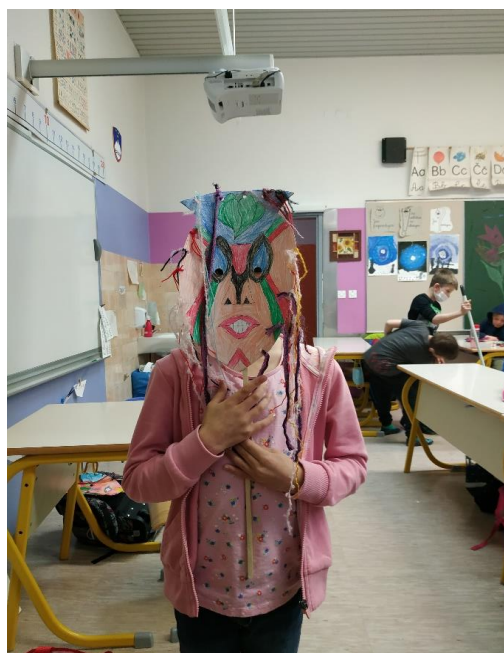
Maske smo izdelali tudi pri pouku