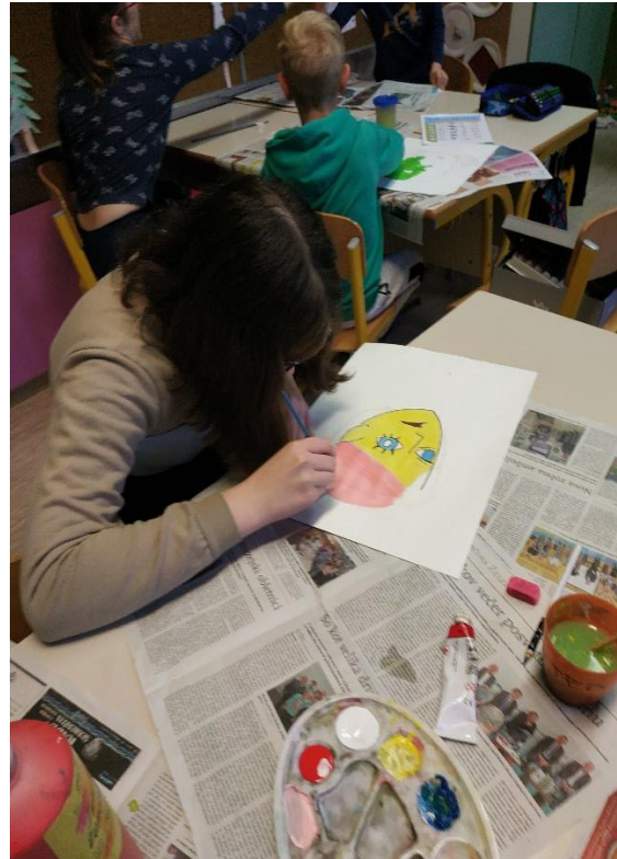
USTVARJALCI NA DELU