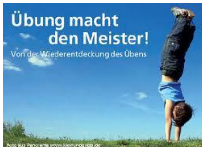
Vaja dela mojstra.

V sedmem razredu se učimo npr. predstaviti sebe ali tretjo osebo v nemškem jeziku, države, barve, številke, šolske predmete, opisati svojo družino, hišo ali stanovanje, povedati kaj počnemo v prostem času in še mnogo več. V osmem razredu se učimo povedati kaj znamo, hobije, hrano, obleke, počitnice, vodimo dialoge v trgovini in restavraciji in drugo.