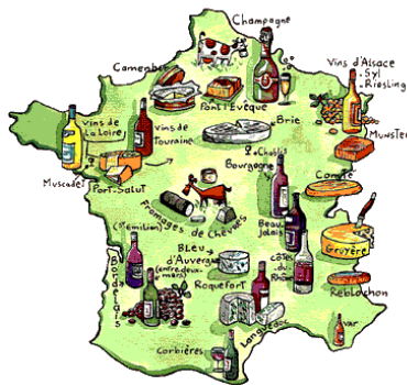
Francija je dežela sira in vina