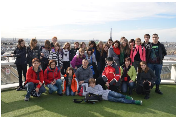
Pariz, Versailles, Disneyland, oktober 2011

V šolskem letu 2011/2012 smo med jesenskimi počitnicami obiskali glavno mesto Francije Paris z Disneylandom , kjer smo neizmerno uživali. Oktobra 2013 smo raziskovali Alzacijo in Strasbourg ter sproščali adrenalin v Evropaparku . Aprila 2016 se ponovno vračamo v Pariz .