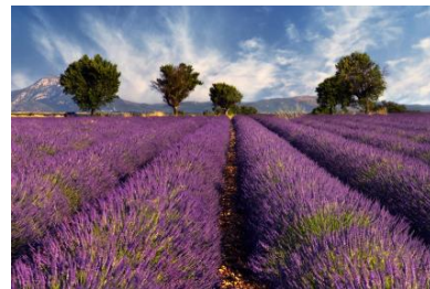
Polja sivke v Provansi

V 7. razredu usvojimo osnovno besedišče (francoske besede, ki jih uporabljamo tudi v slovenščini, pozdravi, številke, barve, poimenovanja za šolske potrebščine, spoznamo osnovne značilnosti Francije in mesto Paris, učenci v nekaj povedih znajo predstaviti sebe in opisati svoj dan).