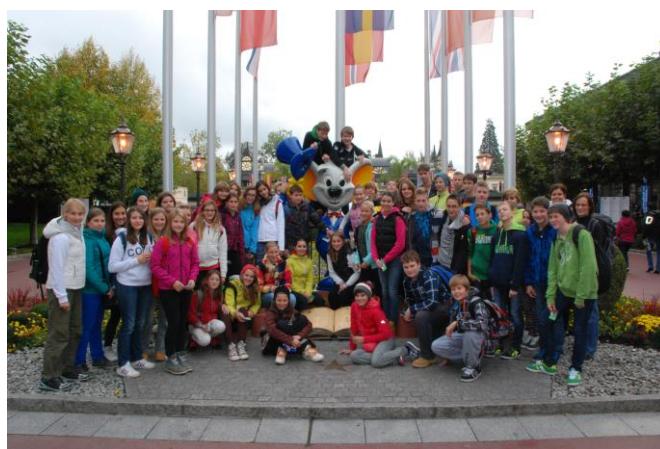
Strasbourg, Evropapark, oktober 2013

Odkrivali bomo bogastvo francoske kulture, navade, praznike, specialitete francoske kuhinje, zemljepis in zgodovino. Pouk poteka v francoskem in slovenskem jeziku. Učenci spoznavajo jezik preko petja, pišejo dialoge, nareke, igrajo različne vloge, odkrivajo svet francoskega jezika s pomočjo igrice, izdelovanja plakatov in svojega lastnega slovarja. Uporabljamo tudi moderne metode poučevanja, kot sta medmrežje in interaktivna tabla.