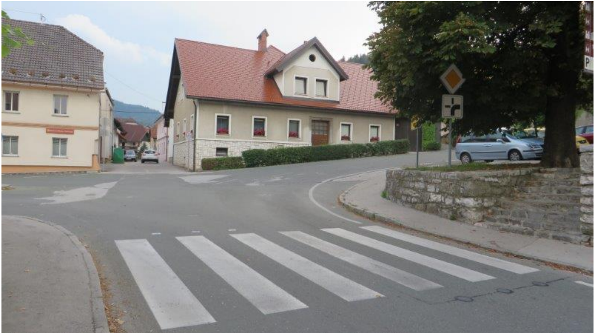
Prehod Spodnji trg – Pepetov klanec – Mestni trg