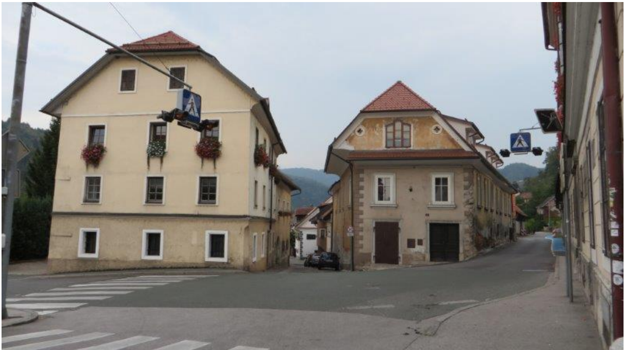
Prehod pri Upravni enoti in ožina na Poljansko cesto