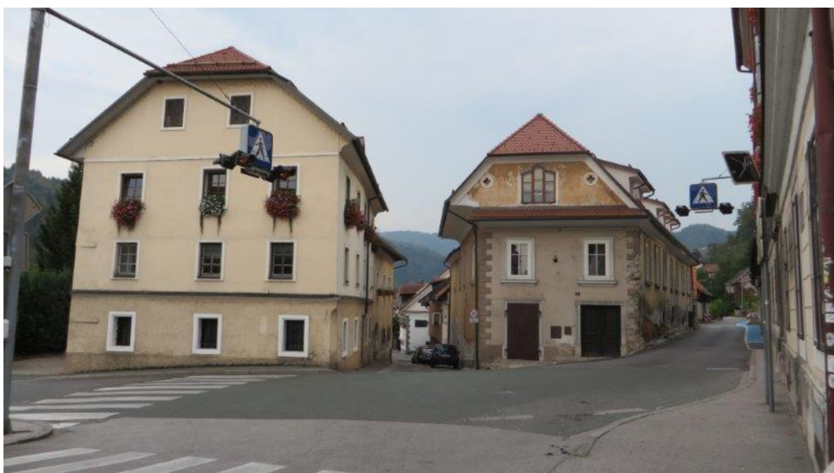
Prehod pri Upravni enoti in ožina na Poljansko cesto