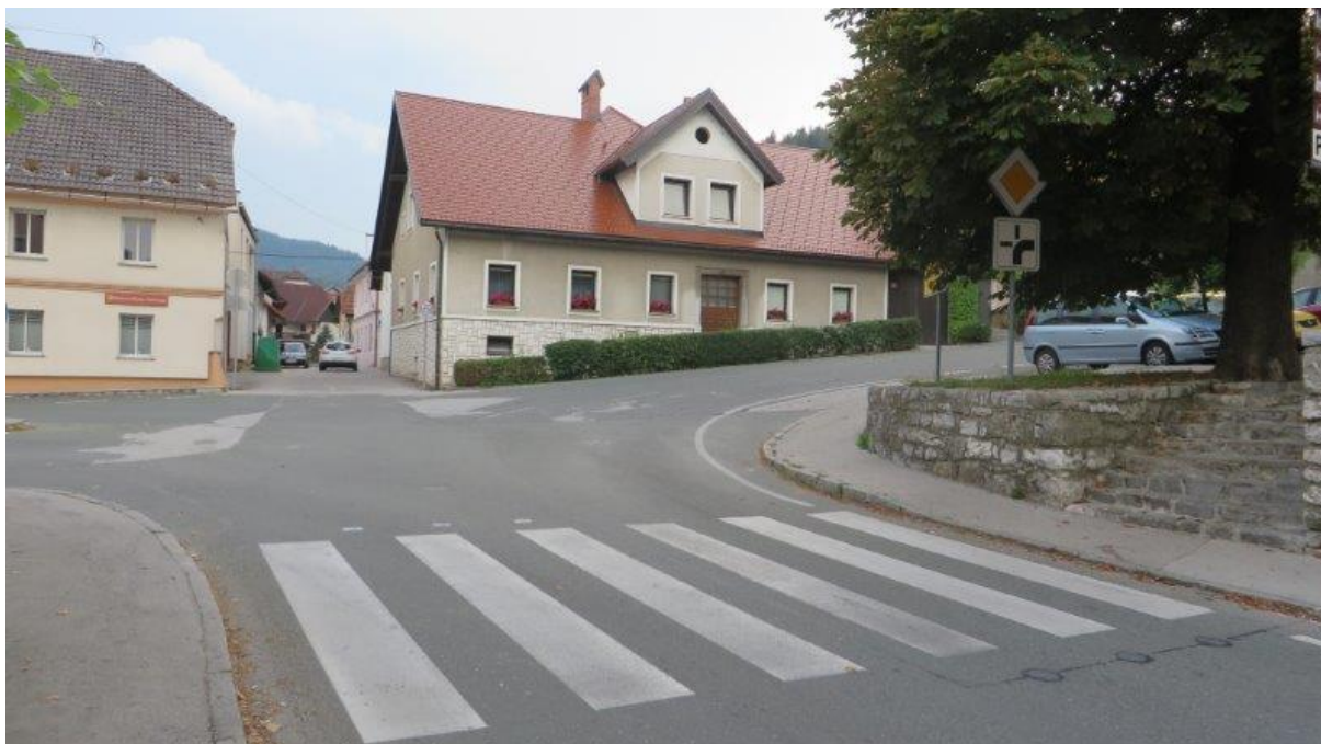
Prehod Spodnji trg – Pepetov klanec – Mestni trg