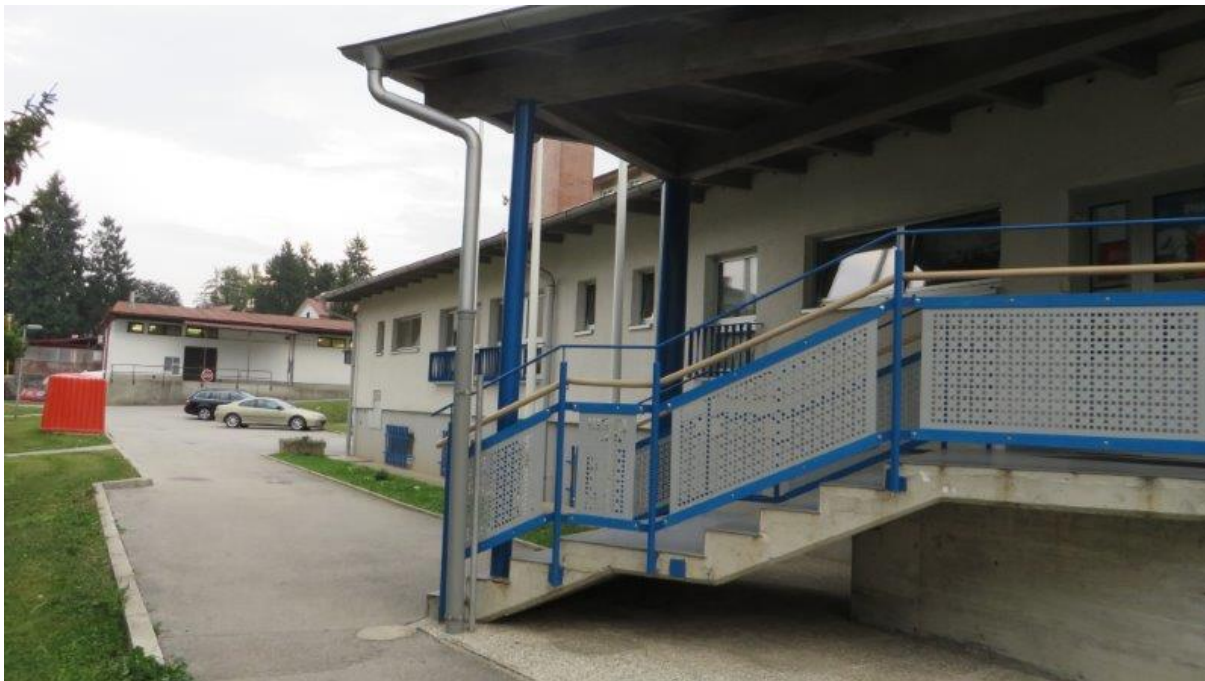
Na Novem svetu ni urejenega postajališča kombijev.