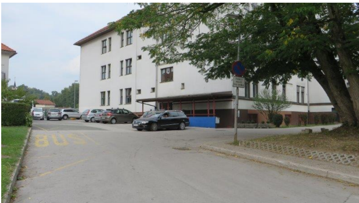
Na Šolski ulici je na dovozni poti na parkirišče postajališče kombijev samo zarisano. Učenci čakajo na prevoz pod drevesom ali med avtomobili, ko kombi pripelje pa preko voznih površin in izza vozil pristopajo h kombijem.